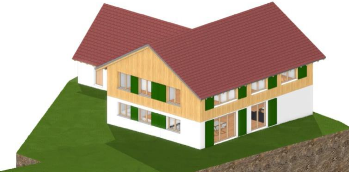
Vorhabenplan Oberbrunner Weg 8, Isometrie (links der Oberbrunner Weg; im Vordergrund der an der Ostseite um 1 Geschoss aufgestockte Gebäudeteil)

Das geplante Gebäude fügt sich nach Art und Maß der baulichen Nutzung, der Bauweise und der Grundstücksfläche, die überbaut werden soll, in die Eigenart der näheren Umgebung ein. Da durch die geplante Erweiterung des Bestandsgebäudes nach Osten jedoch die Grenzen des im Zusammenhang bebauten Ortsteils überschritten werden, ist eine Zulässigkeit nach § 34 BauGB nicht gegeben. Nach § 246e BauGB ist in diesem Fall jedoch ein Abweichen von den Vorschriften des BauGB mit Zustimmung der Gemeinde möglich.