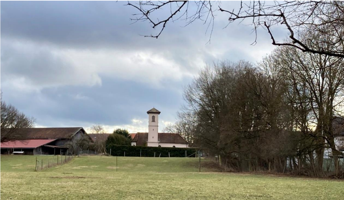
Eingrünung östlicher Ortsrand Hausen von Norden mit Blick auf die Kirche.

Die Baumreihe entlang der östlichen Grundstücksgrenze bildet einen eindrucksvollen Übergang zwischen dem Siedlungsbereich und der umgebenden Landschaft. Der Erhalt, bzw. die Umsetzung dieser Ortsrandeingrünung stellen daher ein städtebauliches Ziel der Gemeinde dar.