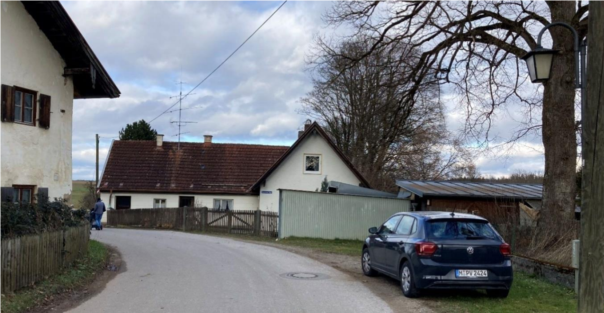
Gebäudebestand Oberbrunner Weg 8 von Süden.

Die Vorhabensgrundstücke Fl. Nrn. 632 und 623/2 befinden sich östlich des Oberbrunner Wegs nördlich der Dorfkirche. Sie stehen im räumlichen Zusammenhang mit Flächen, die nach § 34 BauGB zu beurteilen sind. Durch die Lage an der öffentlichen Verkehrsfläche ist die technische und verkehrliche Erschließung gesichert. Das Grundstück Fl. Nr. 632 ist gegenwärtig mit einem winkelförmigen eingeschossigen Wohngebäude mit Satteldach bebaut. Durch den geschwungenen Verlauf des Oberbrunner Wegs ist die Grundstückstiefe sehr gering; sie verringert sich von 20 m im Norden auf lediglich 6 m im Süden. Dies erschwert eine Wiederaufnahme der Wohnnutzung. Der nördliche Teil des Bestandsgebäudes Oberbrunner Weg 8 ragt in den Straßenraum und bildet dadurch eine Engstelle aus.