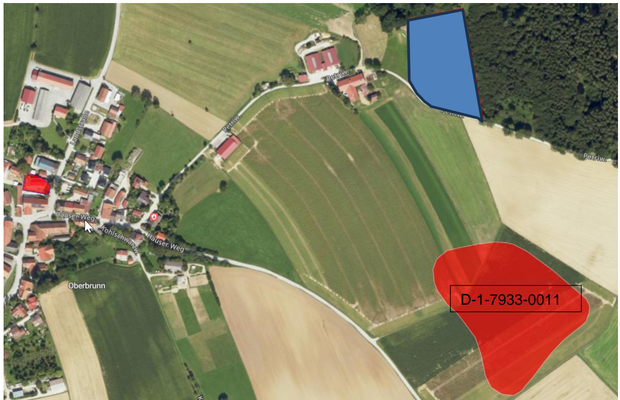
Abb. 3 Bau- und Bodendenkmäler, ohne Maßstab

In der näheren Umgebung, insbesondere im Bereich der Ortsmitte ist das Baudenkmal Dorfkirche „St. Peter und Paul“ (D-1-88-120-46) vorhanden, für die jedoch von der beabsichtigten Änderung keine Beeinträchtigung zu erwarten ist.