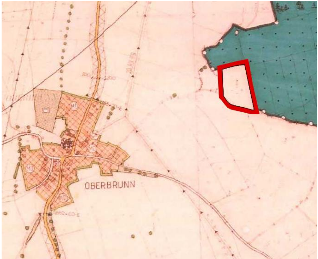
Abb. 1 Ausschnitt rechtswirksamer Flächennutzungsplan mit Änderungsbereich (rot), ohne Maßstab, © Bayerische Vermessungsverwaltung,

Im Plangebiet ergibt sich folgende Flächenverteilung: